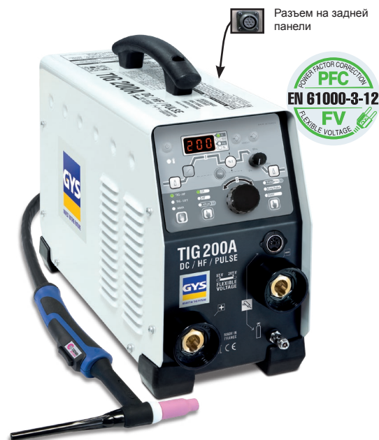
Разъем на задней панели

Для подключения ножного (арт. 045682) или ручного дистанционного управления (арт. 045675).