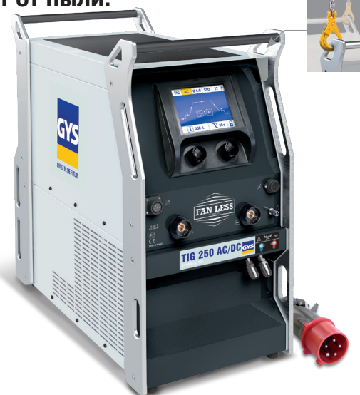
Аппарат поставляется без аксессуаров.