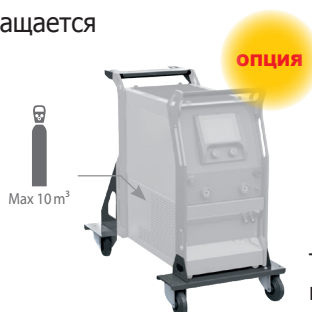
Тележка ref. 040960

Режим Easy или режим PRO для полного доступа к выбору параметров.