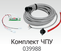
Комплект ЧПУ 039988

Для использования на столе для плазменной резки: