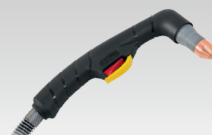
Ручная Горелка МТ-70 70А (50%) 6 м - 037502 12 м - 037519