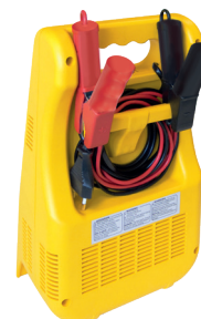
Гнездо для кабелей и зажимов.