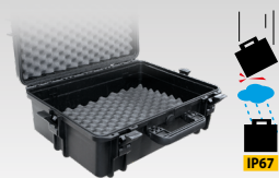
Кейс для транспортировки 060432