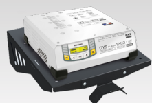
Полка с настенным креплением 055513