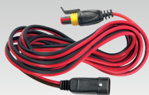
Удлинитель 2.5 м - 029057