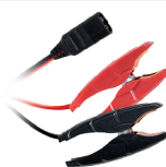
Зажимы (35 см)