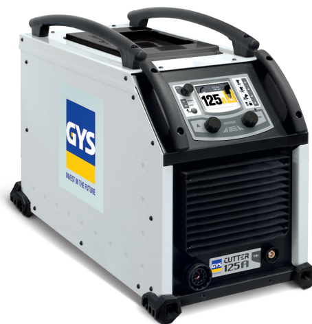
Поставляется с зажимом массы (4м, 16 мм²)