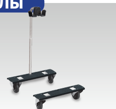
Тележка + Кронштейн арт. 039575