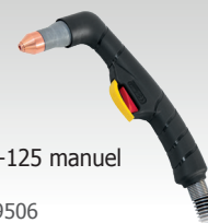
Горелка МТ-125 manuel 130A (60%) 6м - арт. 039506 12м - арт. 039513