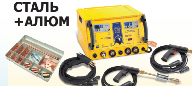
SPEEDLINER Combi 230 E PRO - Арт. 036062