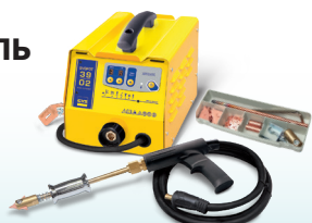
SPEEDLINER 39.02 - Арт. 035010 SPEEDLINER 39.04 - Арт. 035027