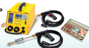
SPEEDLINER PRO 230 - Арт. 036017 SPEEDLINER PRO 400 - Арт. 036024