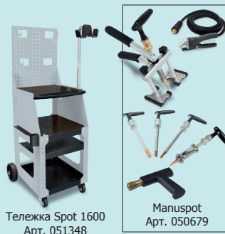
Тележка Spot 1600 Арт. 051348