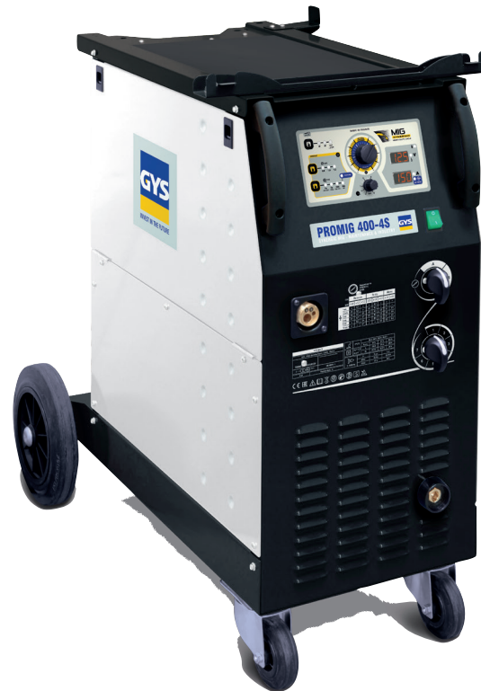
- Поставляется без аксессуаров (арт. 035898)