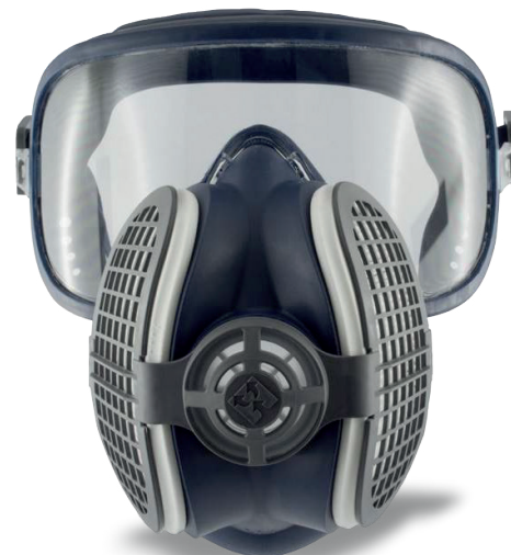
Фильтры поставляются в наборе

Для производства этой маски и фильтров использовались гипоаллергенные материалы без запаха, не содержащие латекса и силикона, уровня качества медицинских изделий.