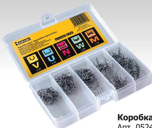
Коробка с 250 скрепками Арт. 052413