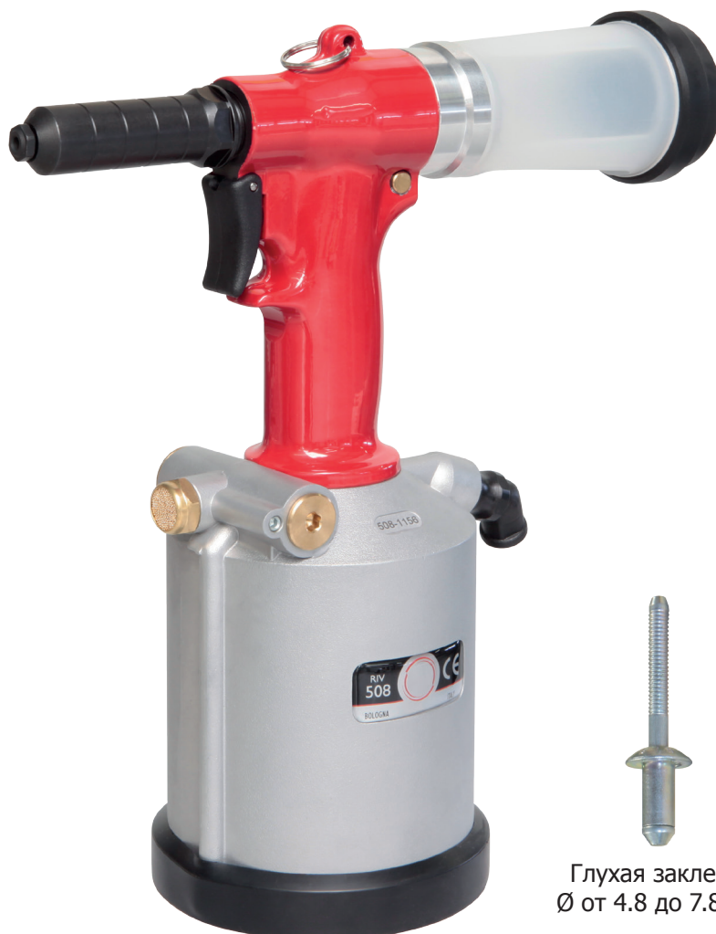
Глухая заклепка Ø от 4.8 до 7.8 мм