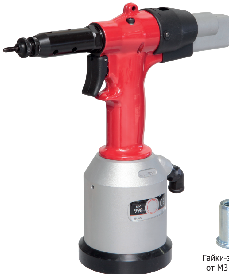
Гайки-заклепки от M3 до M12