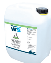
ref. 062511 специальная сварочная охлаждающая жидкость - 5 л