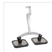
Ножка с двумя опорами длинная Арт. 059368 Арт : 059375 (x2)