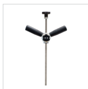
Стержень для рейки для правки Арт. 059399