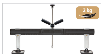
Рейка для правки Премиум-класса Арт. 059306