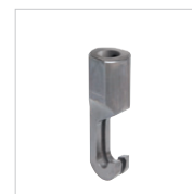
Зацеп с 2 крючками Арт. 059382