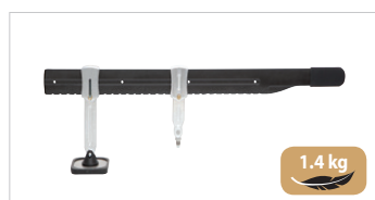
Рычаг для правки Премиум-класса Арт. 059290