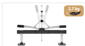
Рейка для вытягивания вмятин Премиум-класса Арт. 058996