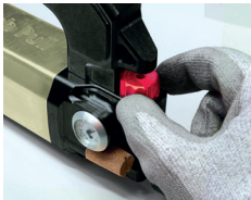
Настройка давления от 0 > 6.5 бар