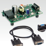
Комплект NUM TIG-1 037960