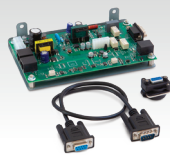
Комплект NUM MIG-1 062993

Основные комплекты для установки в генераторе